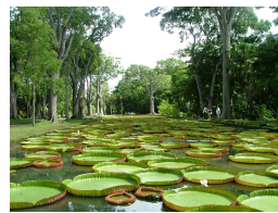
パンブルムース植物園