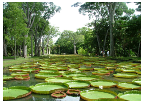
パンブルムース植物園