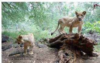
ウォークwithライオン(イメージ)