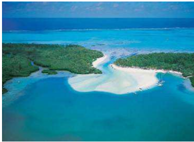
イル・オ・セルフ

ポワント・ジェローム(空港近く)09:15発 予定 ポワント・ジェローム(空港近く)16:30着 予定