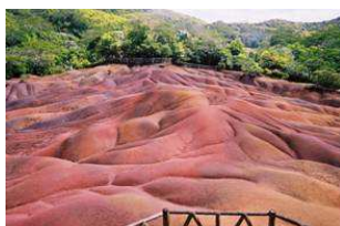
シャマレル7色の大地